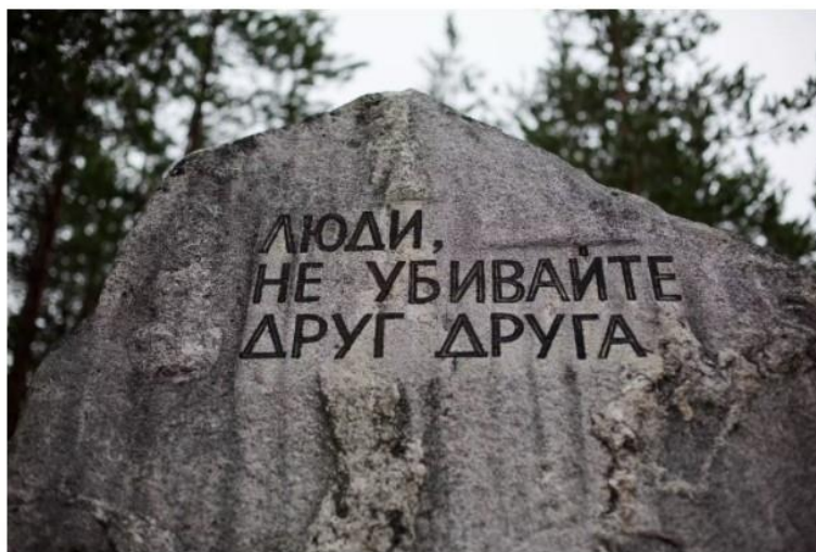
Lidé, nezabíjejte se! Nápis na pamětním místě v Sandarnochu

Putin prosazuje systém, jenž vychovává obyvatelstvo k patriotismu a nepřipouští pochyby o sovětské epoše